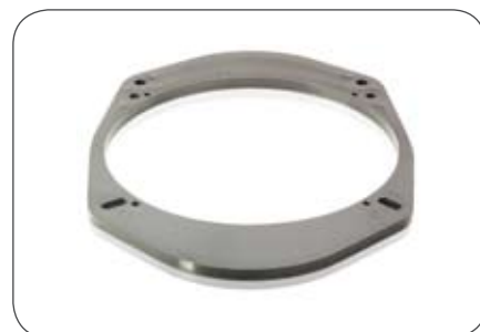
Lautsprecher-Einbauring für 165 mm Lautsprecher für Ford Transit