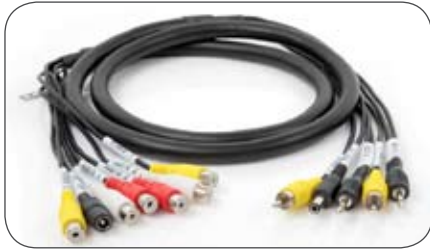
Multifunktionsleitung für Daewoo Monitore