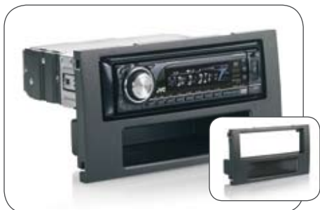
1-DIN-Radio-Einbaublende mit integriertem Ablagefach

Zubehör für Ford Transit ab Baujahr 2007