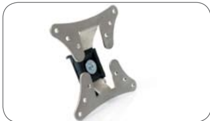
Adapterhalterplatte für Schnepel Halter