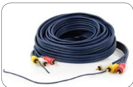
Cinch-A/V-Leitung 6 m mit Remote-Leitung