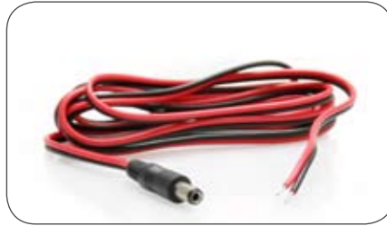
Anschlussleitung 2,5/5,5 mm mit losen Kabelenden für den festen Anschluss