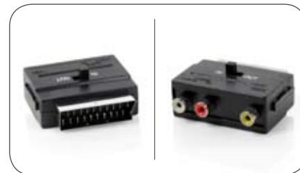
Adapter Scart-Cinch-Adapter, umschaltbar