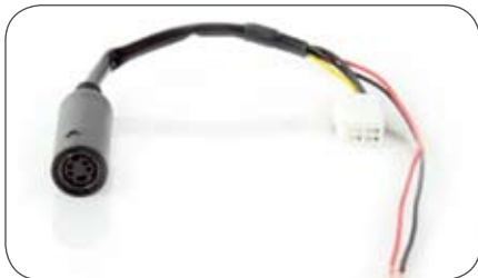
Adapter Kameraeingang Eclipse auf 4-polige Kupplung