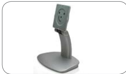
Standfuß für Daewoo L750M, L950M und L2200M

für Daewoo L2200M (o. Abb.) Art.-Nr. MC029222