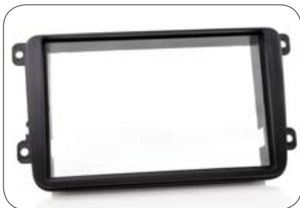
Doppel-DIN-Blende für T5, Golf 6, u. a.