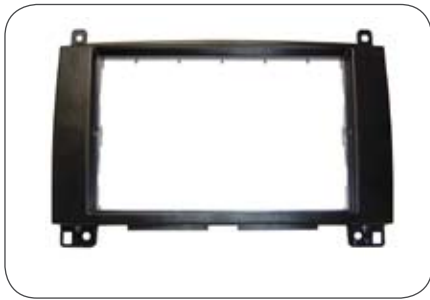
Doppel-DIN-Blende für Mercedes Sprinter mit Radio- vorbereitung

Je nach Ausstattung sind zum Einbau eines Doppel-DIN-Gerätes unterschiedliche Radioblenden erforderlich. Der CAN-Adapter ermöglicht auch die Nutzung der originalen Lenkrad-Fernbedienung in Verbindung mit Pioneer Geräten.