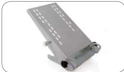
Halterplatte mit Gelenk für Halter MC029075