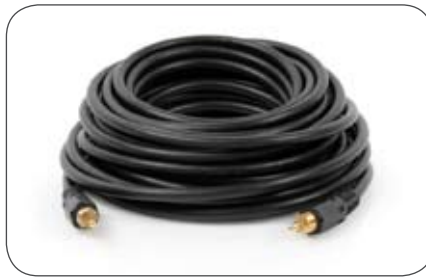
Videoleitung 75 Ohm, 10 m, Cinch-Cinch Stecker