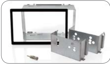
Einbausatz universell für Eclipse Navigationssysteme