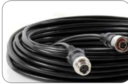
Kameraleitung, 6-polig 20 m mit 6-poliger Metallverschraubung beidseitig