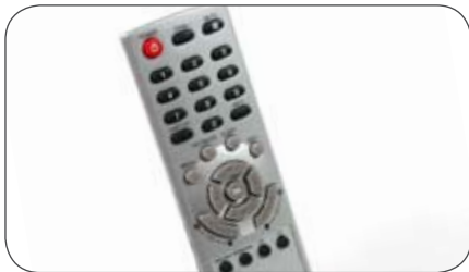
Fernbedienung für Daewoo L750M und L950M