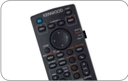
Kenwood Fernbedienung KNA-RCDV331 passend für z. B. Kenwood Navigation DNX5260BT u.v.m.