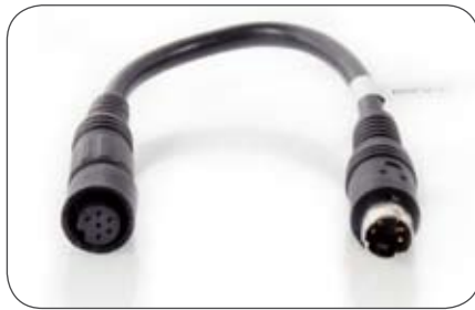
6-polige Mini-Schraubkupplung auf 4-poligen Stecker