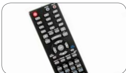
Fernbedienung für Caratec Vision CAV190 LCD TV