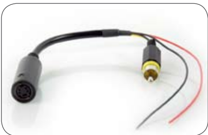
4-polige Kupplung auf Cinch-Stecker (Video)