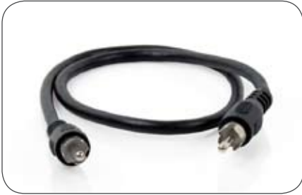
Videoleitung 75 Ohm, 0,5 m Cinch-Cinch Stecker