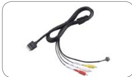
iPod Leitung IPC409 für Eclipse Navigation AVN4429