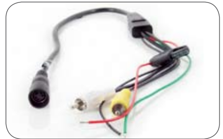
4-polige Kupplung auf Cinch-Stecker (Audio/Video)