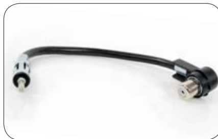
Radio Antennen-Adapter für 75 Ohm Antenne auf geraden 150 Ohm Antennenanschluss, 0,2 m