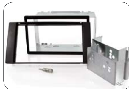
Einbausatz für Eclipse Navigation für Ford Transit