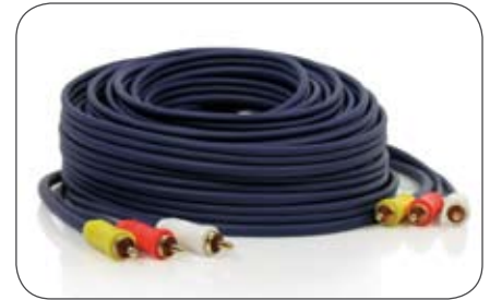
Cinch-A/V-Leitung, 3 m