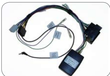
CAN Adapter und Lenkrad- Fernbedienung Interface Interface für Pioneer Geräte