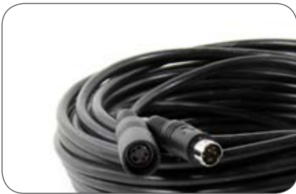
Kameraleitung, 4-polig, 20 m