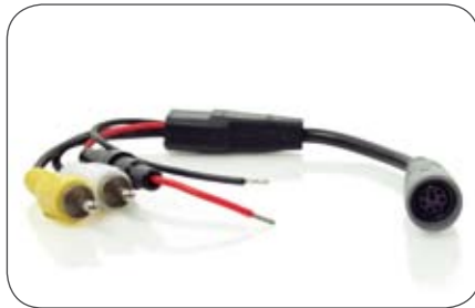
6-polige Kupplung auf Cinch-Stecker (Audio/Video)