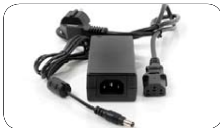
230 V Netzteil für Caratec Vision LED TV Geräte (2,1/5,5 mm)