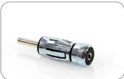
Radio Antennen-Adapter 75 Ohm Antenne auf geraden 150 Ohm Antennenanschluss