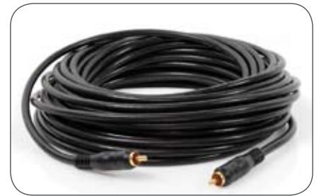
Videoleitung 75 Ohm, 15 m, Cinch-Cinch Stecker