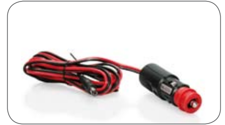
Anschlussleitung 2,5/5,5 mm mit Stecker für Bordsteckdose und Zigarettenanzünder