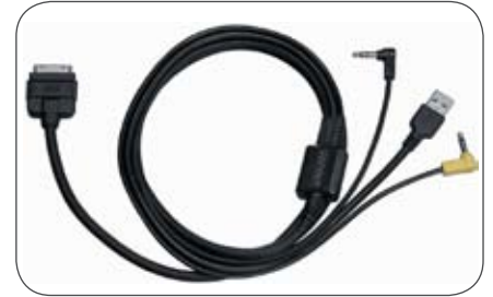
Kenwood iPod Direktanschlusskabel KCA-IP301V passend für viele Kenwood Geräte mit iPod/iPhone Steuerung.