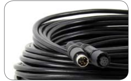
Kameraleitung, 6-polig auf 4-polig 20 m mit 6-poliger Mini-Schraubkupplung auf 4-poligen Stecker