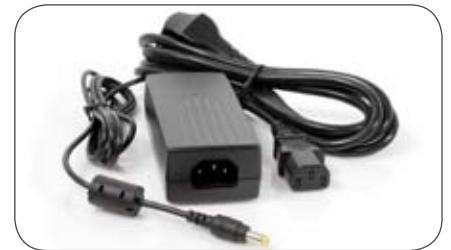
230 V Netzteil für Daewoo L750M, L950M (2,5/5,5 mm)