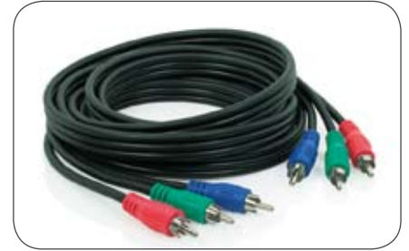
Component Video-Leitung 75 Ohm, 3 m, Cinch-Cinch Stecker