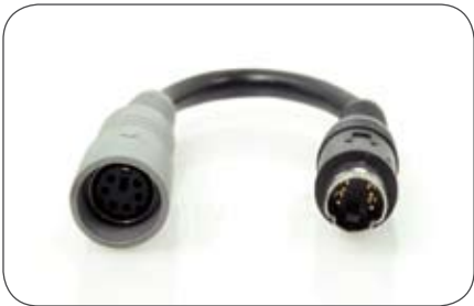
6-polige Kupplung auf 4-poligen Stecker