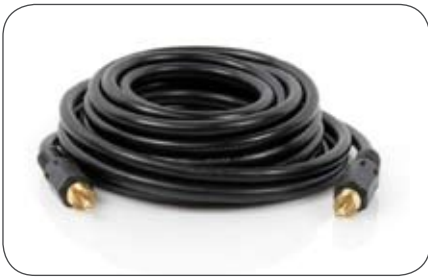
Videoleitung 75 Ohm, 5 m, Cinch-Cinch Stecker