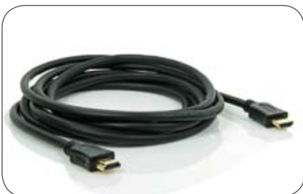
HDMI-Leitung 2 m 1.4, ATC-zertifiziert Art.-Nr. MCL29015