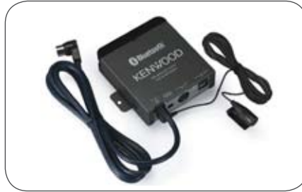
Kenwood Bluetooth-Freisprecheinrichtung KCA-BT200 passend für Kenwood Geräte mit Bluetooth Schnittstelle.