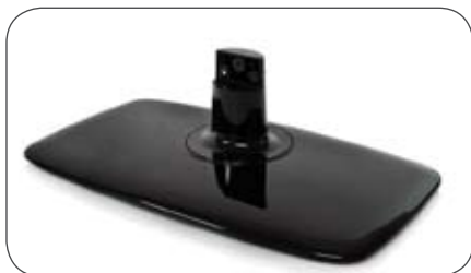
Standfuß für Caratec Vision LED Geräte