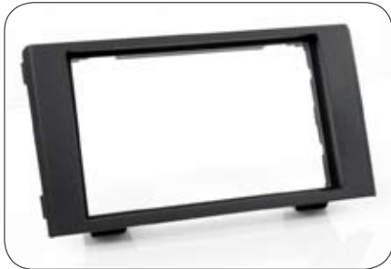
Doppel-DIN-Blende für Iveco Daily 2007