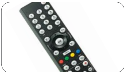
Fernbedienung für AVN726EE/ EEW/EEWT bitte Caratec Fernbedienung CAV100RC verwenden (s. Zubehör Fernbedienung)