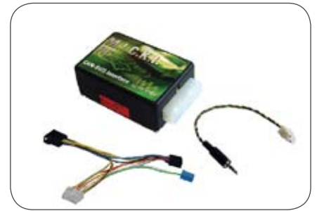
CAN Interface für Mercedes Sprinter mit Radio- vorbereitung