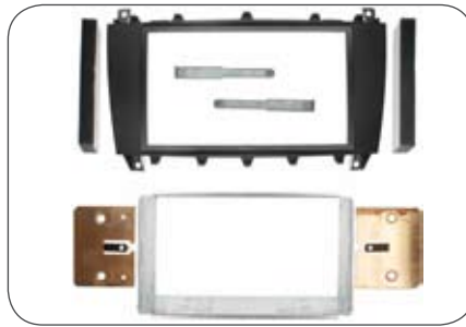
Doppel-DIN-Blende für Mercedes Sprinter (Quad Lock)