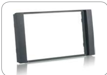
Doppel-DIN-Radio-Einbaublende passend z. B. für Pioneer oder Kenwood Doppel-DIN-Geräte