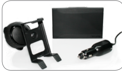
Travel-Kit Zweitwagen-Kit für Eclipse AVN4429