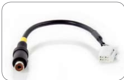
Stecker für Eclipse Kameraeingang auf Cinch-Kupplung