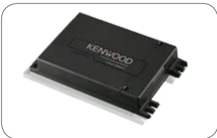
Kenwood Navigationsrechner Rechner KNA-G620 mit TMC-Modul, passend für Kenwood Moniceiver