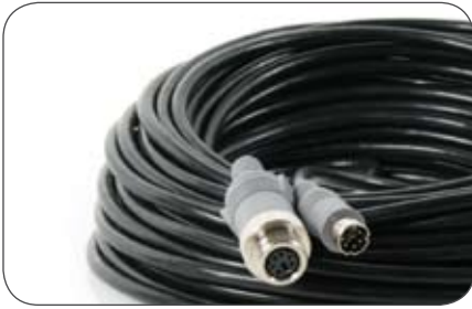
Kameraleitung, 6-polig 15 m mit 6-poliger Metallverschraubung auf der Kameraseite