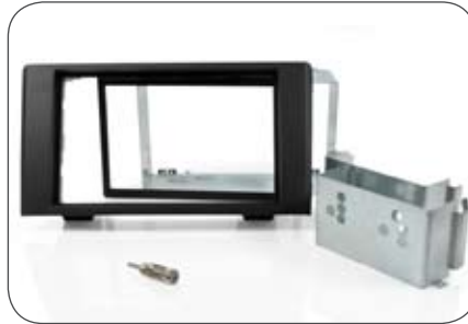
Einbausatz für Eclipse Navigation für Iveco Daily 2007