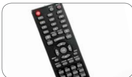
Fernbedienung für Caratec Vision CAV190L LED TV