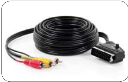
Video-/Audio-Adapterleitung 1 x Scart auf 3 x Cinch-Stecker