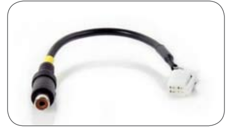
Adapter Kameraeingang Eclipse auf Cinch- Kupplung