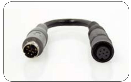
6-polige Mini-Schraubkupplung auf 6-poligen Stecker