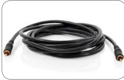
Videoleitung 75 Ohm, 3 m, Cinch-Cinch Stecker