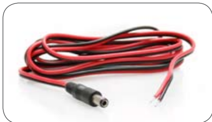
Anschlussleitung 2,1/5,5 mm mit losen Kabelenden für den festen Anschluss