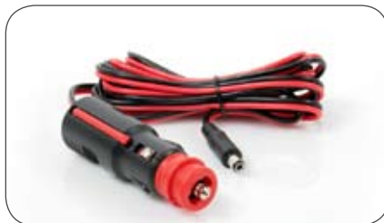
Anschlussleitung 2,1/5,5 mm mit Stecker für Bordsteckdose und Zigarettenanzünder