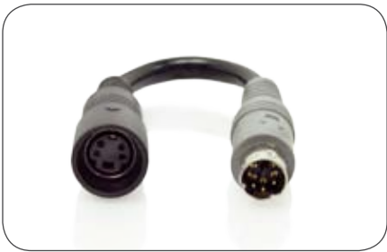
4-polige Kupplung auf 6-poligen Stecker