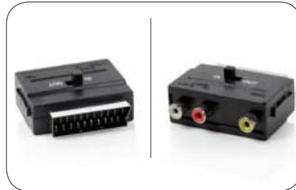
Scart-Cinch-Adapter umschaltbar für Ein- und Ausgang