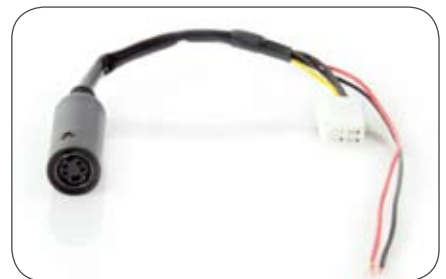
Stecker für Eclipse Kameraeingang auf 4-polige Kupplung